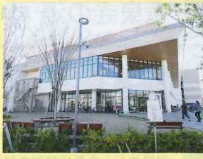
網島駅徒歩約10分には大型ショッピングモール「アビタテラス横浜網島店」

戦前・戦後は、「東京の奥座敷」と呼ばれた大きな温泉街だった網島。東急東横線の急行停車駅で渋谷・横浜両方面へ好アクセスだ。話題は、東急新横浜線(相鉄・東急直通線)の新駅として開業予定の新網島駅。それに伴い、網島駅東口では再開発計画が進められている。両駅はデッキで結ばれるなど、今後の発展が期待される。