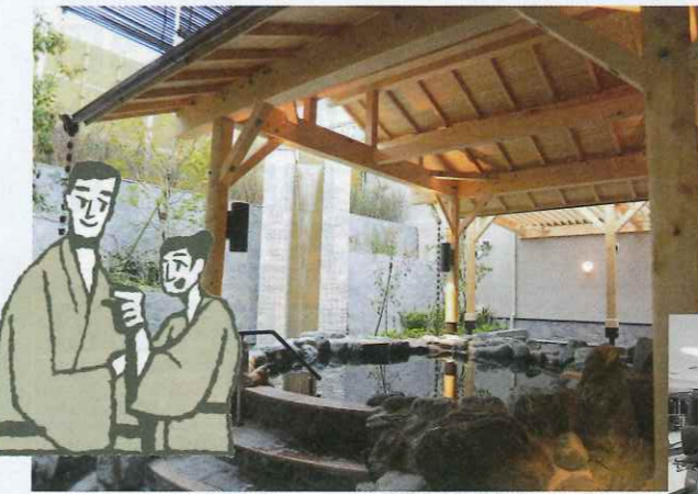
源泉掛け流しの岩風呂。皮膚を滑らかにする作用で美肌効果も

上/レストラン「心音」で四季折々のメニューを堪能できる 下/併設されたフィットネスジム「PRIME fitness & spa」