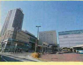
JR鶴見駅東口と京急鶴見駅に挟まれた、商業施設が集積するエリア

京浜東北線のほか、京浜急行本線の京急鶴見駅を利用でき、品川・東京・横浜の各駅に加え羽田空港へも直通。箱根駅伝の中継所としても有名だ。駅ビル「CIAL鶴見」にはスーパー、レストランのほか、保育園や屋上庭園もある。鶴見区内には沖縄から移り住んだ住民が多いことから、現在も沖縄系飲食店・食品販売店が充実している。