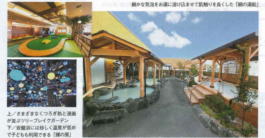
細かな気泡をお湯に溶け込ませて肌触りを良くした「絹の湯船」